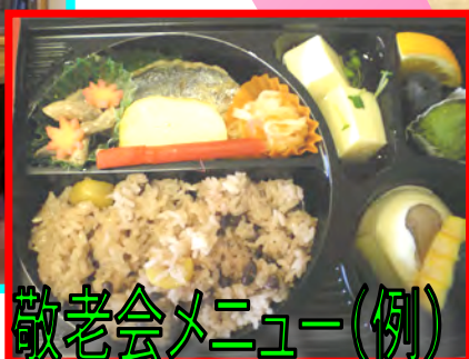
敬老会メニュー(例)

※食前には、嚥下体操や発声体操を実施。 ※本人の状態に合った食事の提供・その日の体調によつての食事内容の変更等にも対応いたします。 ※管理栄養士さんにより、日々のメニューも栄養管理されています。 また、行事食もバラエティに富んでいま