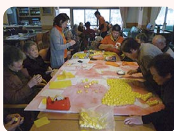
皆様と来年の干支づくりを行ないました。