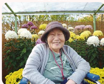
菊を満喫しました