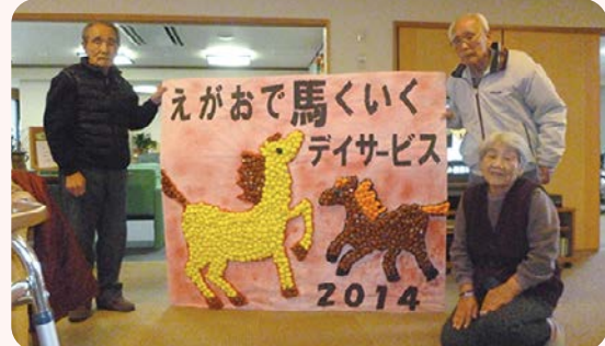
今年の干支・馬の作品完成!! (H25.12月制作)