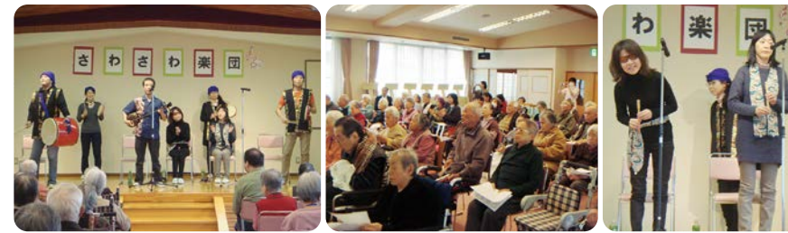
さわさわ楽団(京都府)