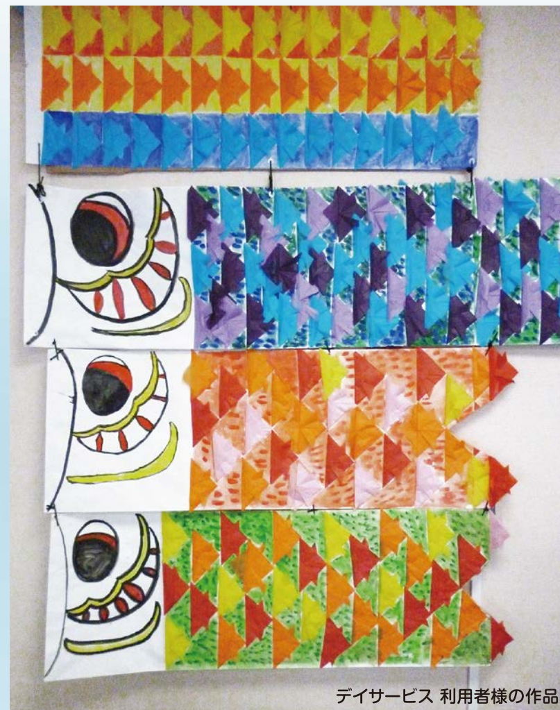
デイサービス 利用者様の作品

暖かい風や優しい日差しが心地よい季節になりました お花見などで皆様それぞれに春を満喫しています