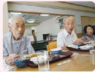
普段と違った雰囲気でお食事を楽しめました。