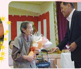
皆様を代表して最高齢者1名、白寿1名 米寿の方5名に花束贈呈を行いました。

【利用時間】 要支援 10:00~15:30 要介護 9:30~16:45 【利用日】 月~土曜日