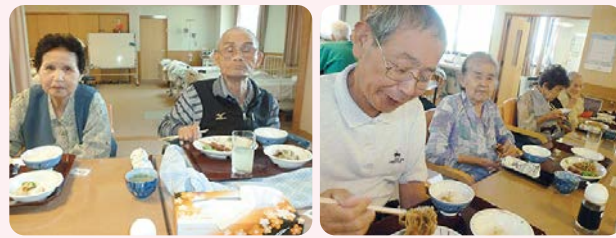
デイサービス最高齢