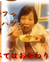
食べてはおかわり!!