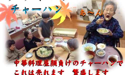
中華料理屋顔負けのチャーハンでした これは売れます 繁盛します