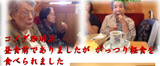
コメダ珈琲店 昼食前でありましたが がつつり軽食を 食べられました