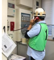
いざ、災害に備え、利用者様も参加し、真剣に取り組みました。