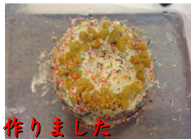
お誕生日祝いにケーキを作りました スポンジもチョコレート味で炊飯器で仕上げ ました 出来栄もばっちり美味しかったです