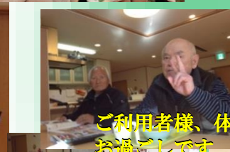
ご利用者様、体調変わりなく元気にお過ごしです