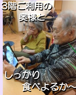
3階ご利用の 奥様と

皆様、こんにちは。いつも感染症というニュースばかりで心も休まりませんね。感染の拡大は抑えられ、徐々に収束に向かっている様ですが、まだまだ気は抜くことはできません。この度、スカイフォンを始めました。ご本人様とお顔を見ながらお話しすることができます。数カ月に渡り、互いに顔を合わさずお過ごしになられていたことと思います。来訪時にはどうぞお気軽に声をかけて頂けたらと思います。今回は各ユニットで皆様のお元気にお過ごしになられている写真を取り上げてみました。どうぞ、ご覧ください。