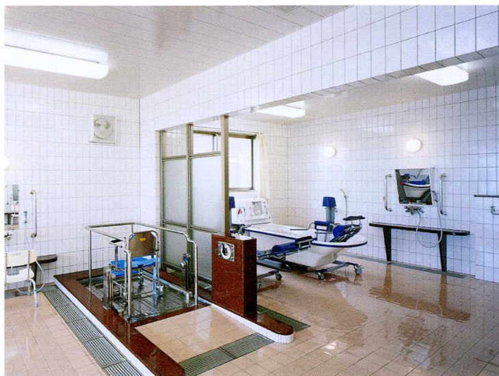
■特浴 椅子にすわったままで、ねたきりで入浴できます。あわ風呂入浴設備。