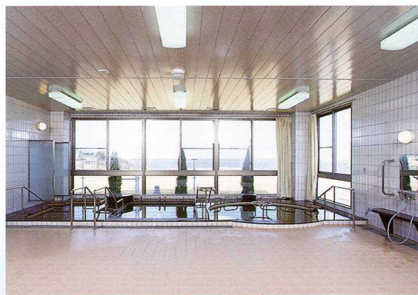
■大浴場(温泉) 含放射能塩化物炭酸水素塩泉