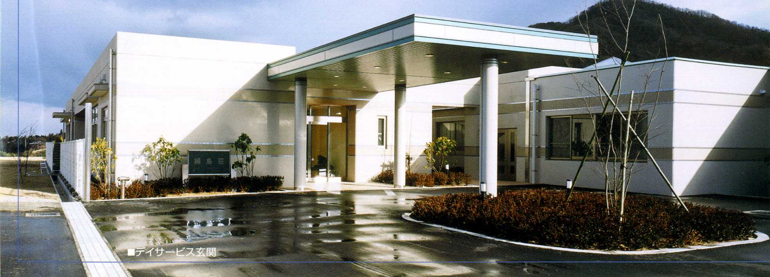
■デイサービス玄関