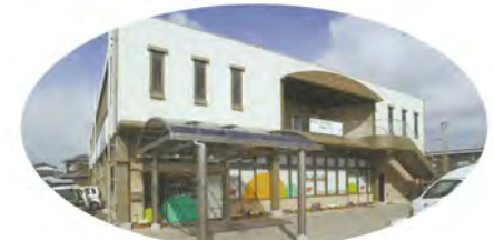
カメリア デイサービスセンター(高松市一宮町)