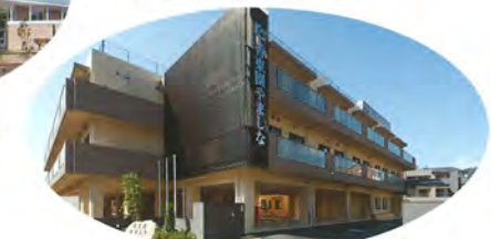
香東園やましな(京都市山科区西野野色町)