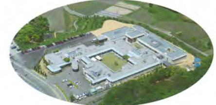
絹島荘(東かがわ市馬橋)