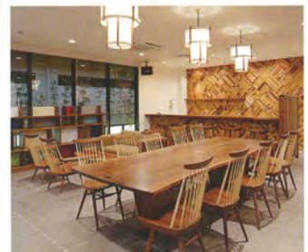
カフェ TSUBAKI 地域の皆様の憩いとくつろぎ、交流のサロンです。