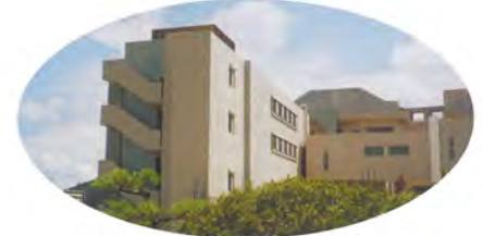
軽費老人ホームB型 華山(さぬき市寒川町)