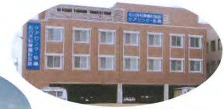
ケアセンター松縄(高松市松縄町)