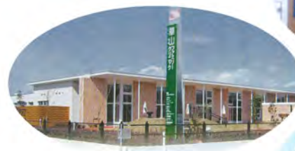
華山ファミリークリニック(さぬき市寒川町)