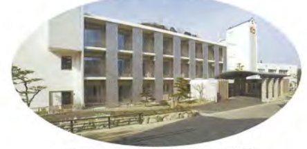
盲養護老人ホーム 香東園(さぬき市寒川町)