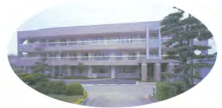
香東園(さぬき市寒川町)