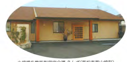
小規模多機能型居宅介護 えんぞ(高松市西山崎町)