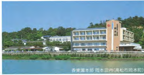
香東園本部 岡本荘内(高松市岡本町)