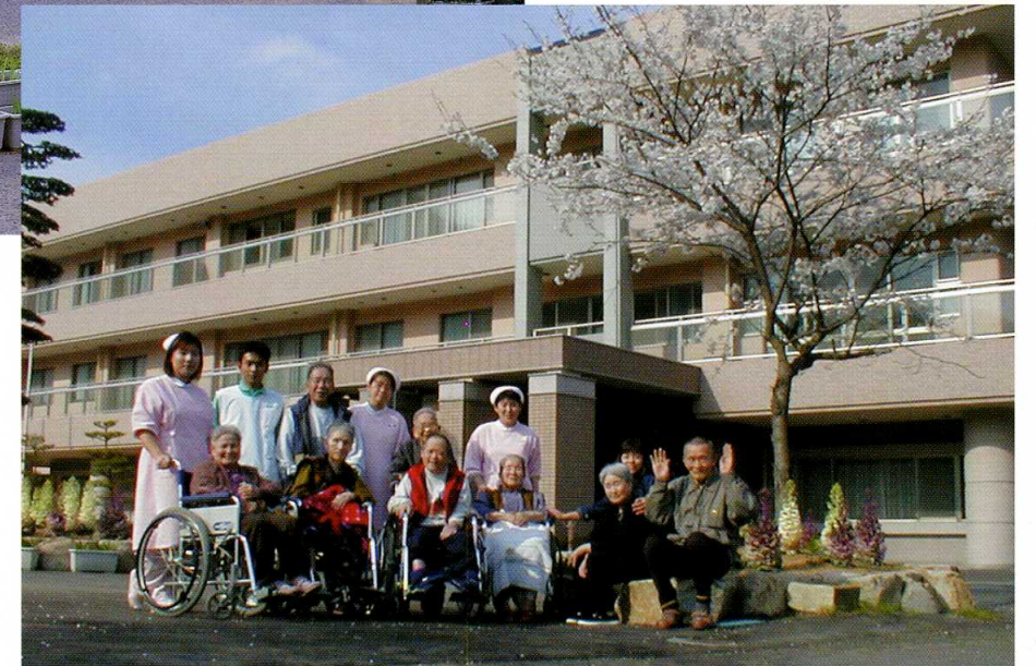
■玄関前桜の木の下で記念撮影