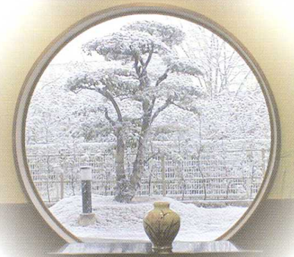
■ロビーから見た冬景色