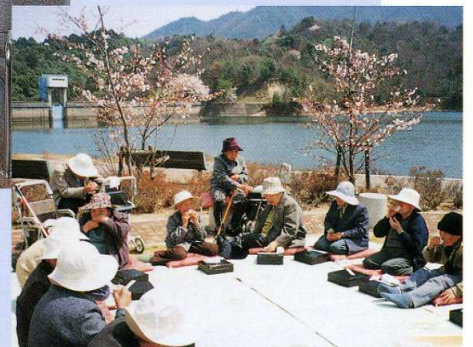
■おいしく野外昼食