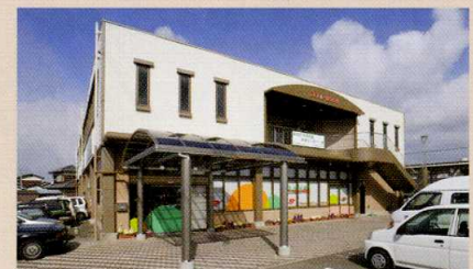
カメリア デイサービスセンター(高松市一宮町)