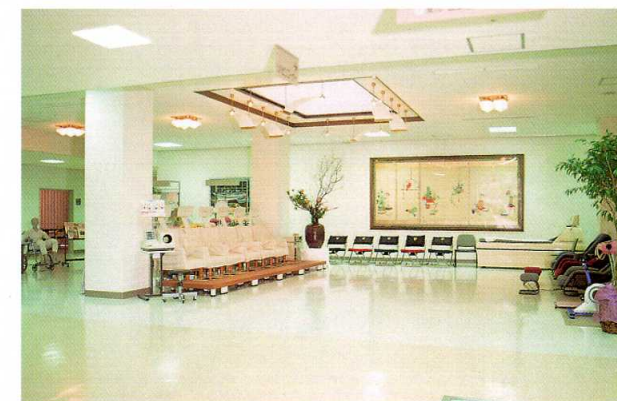
大ホール(リハビリテーション)