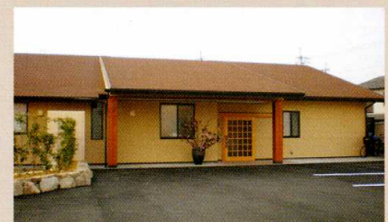
小規模多機能型居宅介護 えんぞ(高松市西山崎町)