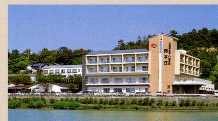
岡本荘(高松市岡本町)