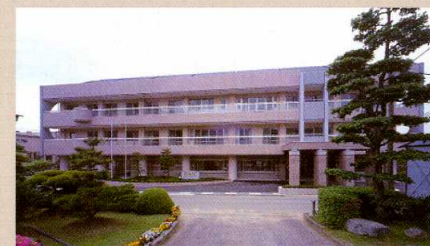
香東園(さぬき市寒川町)