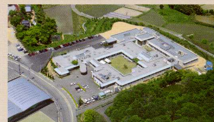
絹島荘(東かがわ市馬塚)